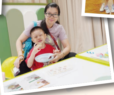
康城早期教育及訓練中心