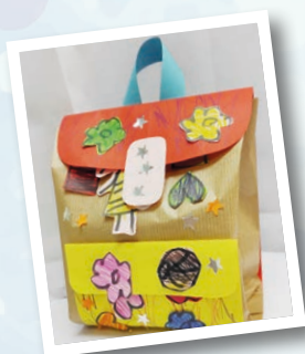
葵盛早期教育及訓練中心 作者：曾穎雪 作品名稱：小書包