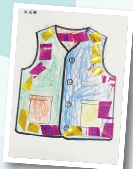
石圍角幼兒中心 作者：麥正燁 作品名稱：美麗的校服