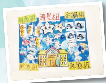
象山幼兒中心 作者：中心全體幼兒 作品名稱：我們溫柔的海洋學校