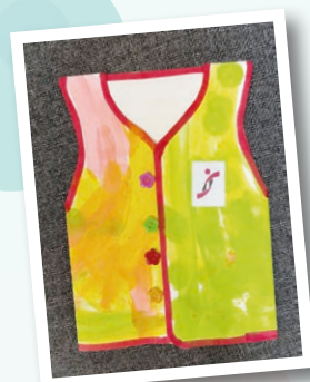
白田幼兒中心 作者：梁諾希 作品名稱：美麗的校服