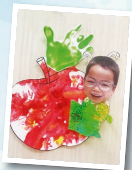
賽馬會方心淑引導式教育中心 作者：楊謙和 作品名稱：我愛小蘋果