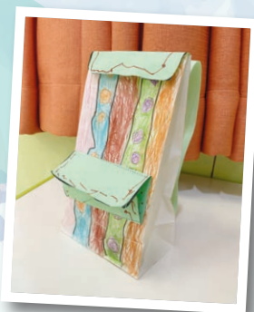
安泰幼兒中心 作者：洪栢希 作品名稱：我的新書包