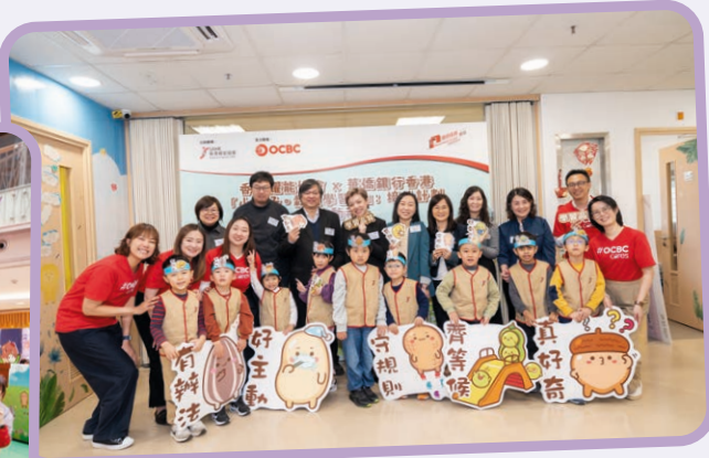
「小種子·栽種學習心： 培幼計劃」啟動禮