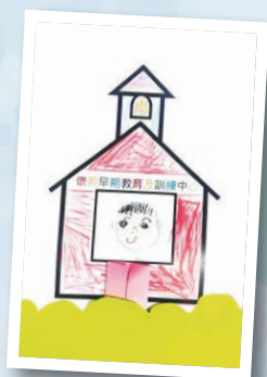
懷熙早期教育及訓練中心 作者：林思雋 作品名稱：開心學習在懷熙