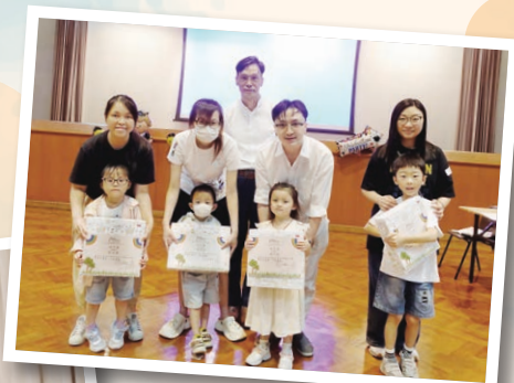
德田早期教育及訓練中心