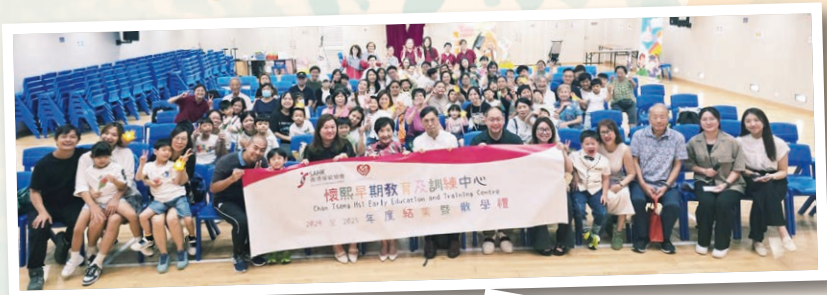
懷熙早期教育及訓練中心

本刊推出之時，開學已過兩個多月了，已升小一的「小校友」習慣了新校園生活嗎？還會掛念在協會幼兒中心的日子嗎？今期《活動花絮》就與大家重溫暑假前各中心的畢業禮盛況，一起回味這個既歡欣又不捨的日子外，也祝福各位小校友繼續愉快成長，好好開展人生新一頁！