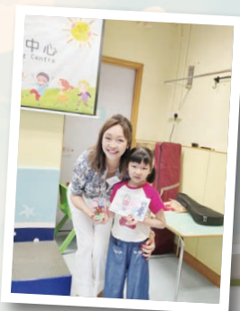
葵盛早期教育及訓練中心