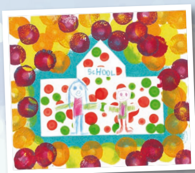
康城早期教育及訓練中心 作者：孫沛瑩 作品名稱：我和我的學校