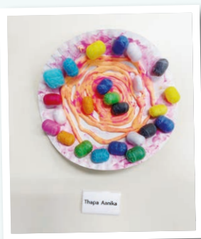
石硤尾幼兒中心 作者：Aanika 作品名稱：Making Noodles at School