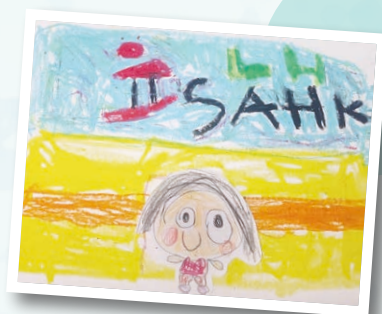
隆亨幼兒中心 作者：鍾承希 作品名稱：我愛隆亨中心