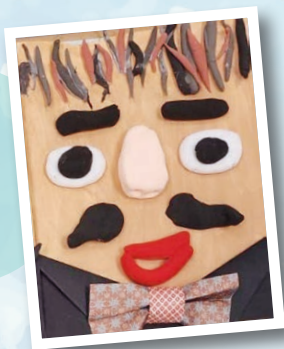
鴨脷洲幼兒中心 作者：李政軒 作品名稱：司機哥哥