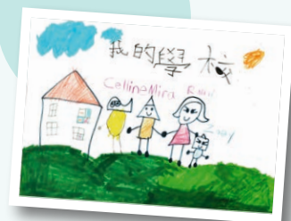
橫頭磡幼兒中心 作者：李凱穎 作品名稱：我的學校