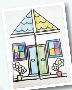
德田早期教育及訓練中心 作者：黎千雯 作品名稱：我愛學校