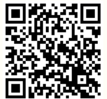
樂同行 親子小組概覽