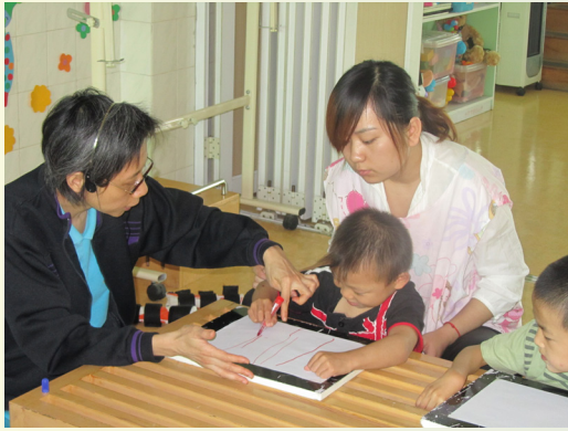
導師在福利院指導寫字的誘發技巧