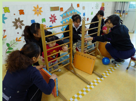
導師在西安市兒童福利院指導如廁