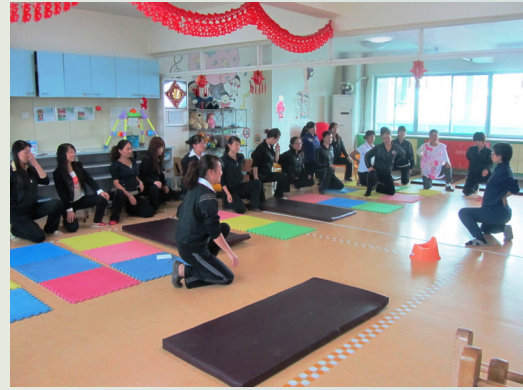
導師在福利院教導員工腰背護理及扶抱技巧

外展顧問服務在家長培訓方面亦對機構及家長作出啟發性的影響。導師即場示範如何指導家長有關康復及學習的觀念及誘發手法，令家長更融會貫通引導式教育的理念、認識自己在孩子康復及成長方面的角色、以及家居訓練的重要。此外，導師實地的家居探訪及指導幫助同工更瞭解及掌握如何推行有效及可行的家居訓練。