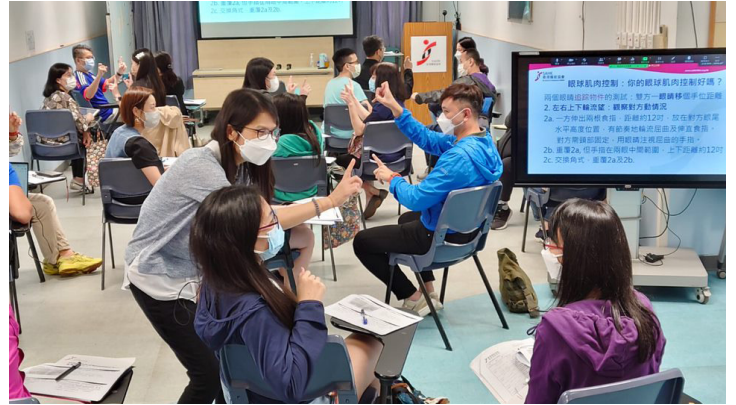
▲參加者分組討論書寫及感知問題之處理