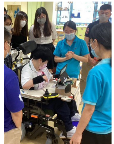
▲肢體傷殘學生示範運用資訊科技於溝通及學習