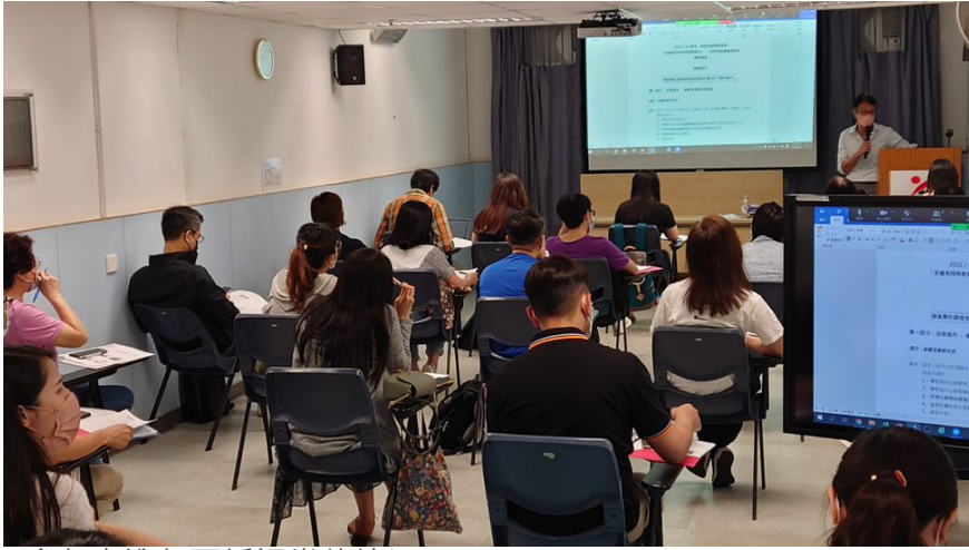
▲參加者進行面授課堂的情況