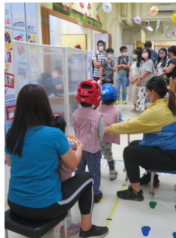
▲參加者參觀賽馬會方心淑引導式教育中心