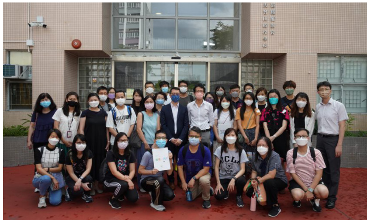
▲參加者在賽馬會田綺玲學校合照

教育局致力推動融合教育，讓有特殊學習需要的學生能在主流學校內與其他學童一同學習。為此，教育局定期舉辦在職培訓課程，以提升教師教導有特殊教育需要學生的能力。經教育局甄選，協會康復專業學院成功投得 2021/22 學年「支援有特殊教育需要學生」— 針對有肢體傷殘學生專題課程的舉辦權，課程為期 10 天 (合共 60 小時)，共三十位老師參加，並於 2022 年 5 月 23 日至 6 月 6 日順利完成。