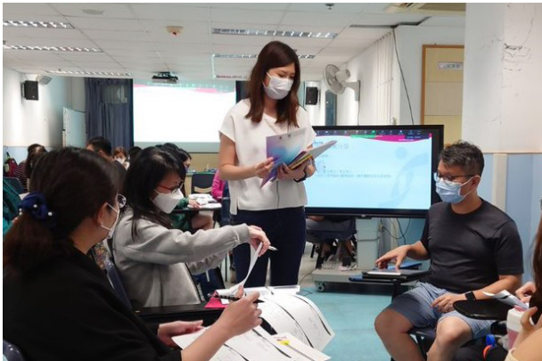
▲導師在小組中分享資訊科技及輔具之應用