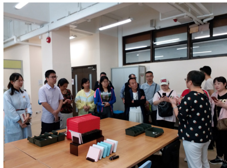
▲展亮技能發展中心導師講解職業評估服務