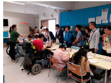
▲協會庇護工場導師講解學員如何製作各類工藝產品