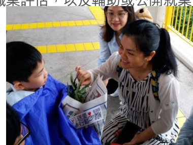
▲內地同工認識有機園內的種植及為學生提供的學習經歷（種植、包裝、贈送街坊）

在這次針對大齡學童職前訓練的觀摩中，協會安排了內地同工參觀學校採用的實境學習情景。學校設計了校本模擬職業平臺，讓學童實際體驗由選擇工作、求職、面試、以致上班等不同方面的學習過程。內地同工更體驗於校內開辦之咖啡室，及觀察學童如何參與其中。