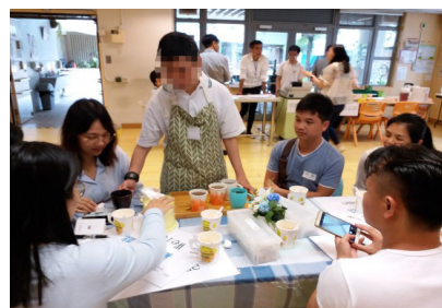
▲內地同工體驗學生在咖啡室的餐飲服務